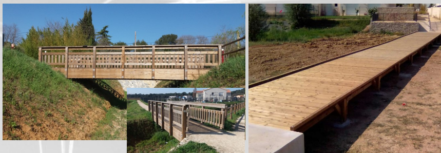
Ponton Bois : 33ml de long, largeur 3m (réalisation juillet 2018)